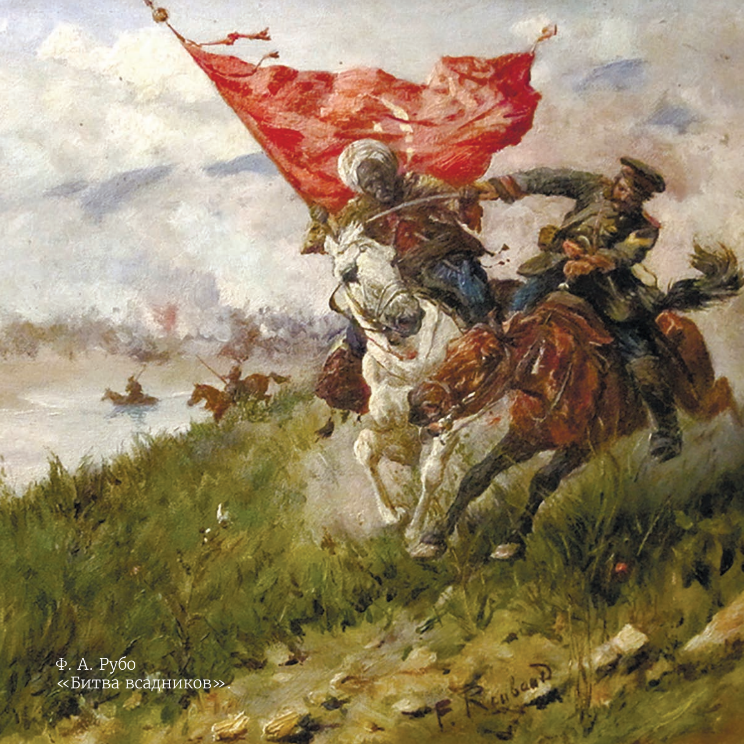
Ф. А. Рубо «Битва всадников»

Шашка – рубяще-колющее холодное оружие. Название происходит от адыгского «сашхо», что в переводе означает большой или длинный нож. Действительно, первые шашки своим прямым клинком напоминали этот предмет домашнего обихода. Наибольшее распространение они получили на Кавказе и отчасти в Средней Азии.