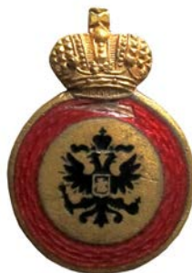
Знак ордена св. Анны IV степени для иноверцев