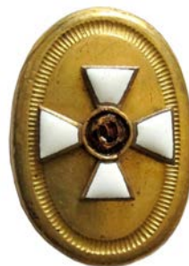
Знак ордена св. Георгия на оружие

должали оставаться на службе и во время Первой мировой войны.