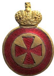
Знак ордена св. Анны IV степени