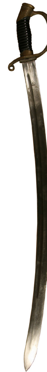
Шашка драгунская офицерская образца 1881/1909 гг.