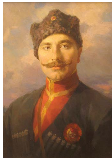
Маршал советского Союза Буденный Семен Михайлович (1883-1973).