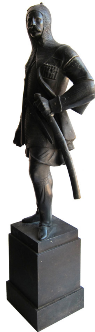
Неизвестный скульптор. Оруженосец Лейб-гвардии Кавказско-горского эскадрона.

В 1909 году изменился дизайн рукоятей, при этом шашки старого образца про-