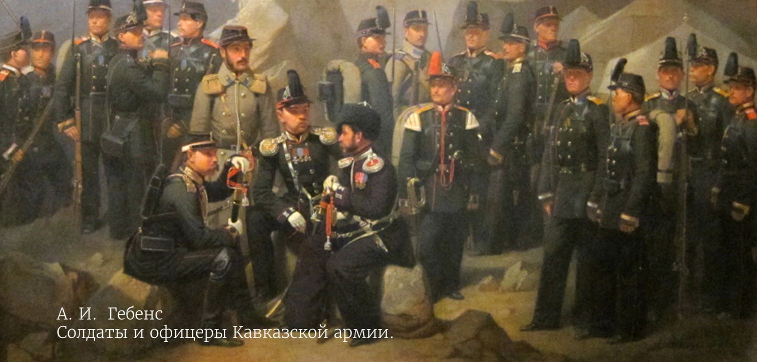
А. И. Гебенс Солдаты и офицеры Кавказской армии.