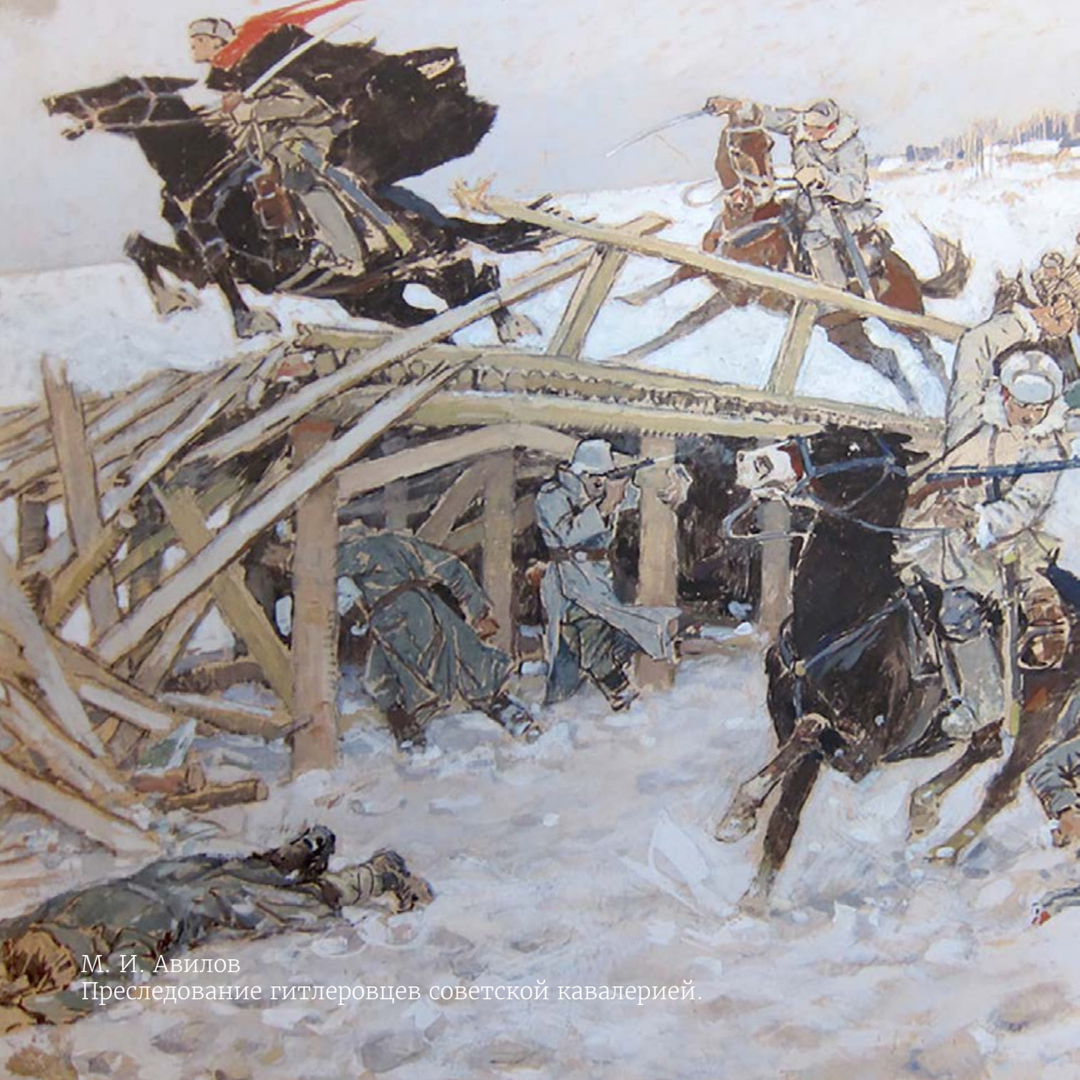
М. И. Авилов Преследование гитлеровцев советской кавалерией.

не помню какой обком прислал И. В. Сталину телеграмму, в которой сообщал, что в одну из кавалерийских дивизий поступили с артсклада шашки, на клинках которых была надпись: «За веру, царя и отечество». Верно, такие надписи были на клинках шашек, оставшихся нам еще со времен первой мировой войны. Правда, на складах ГАУ они были предусмотрительно вытравлены. А вот на каком-то окружном артскладе подобные надписи своевременно не сняли. И теперь обком докладывал об этом самому Верховному.