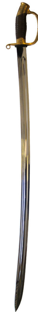
Шашка строевого начальствующего состава обр. 1940 маршала СССР Л. А. Говорова

Вот такая остросюжетная история у нашей российской победной шашки.